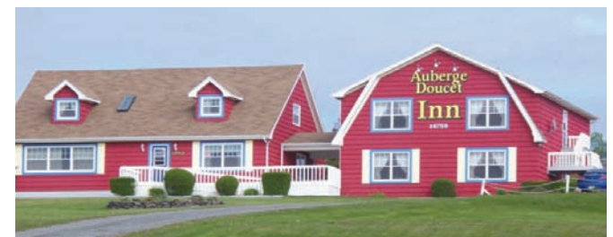
L'auberge Doucet, fondée en 1992, affiche une nouvelle façade suite aux travaux de revitalisation du centre-ville de Chéticamp.