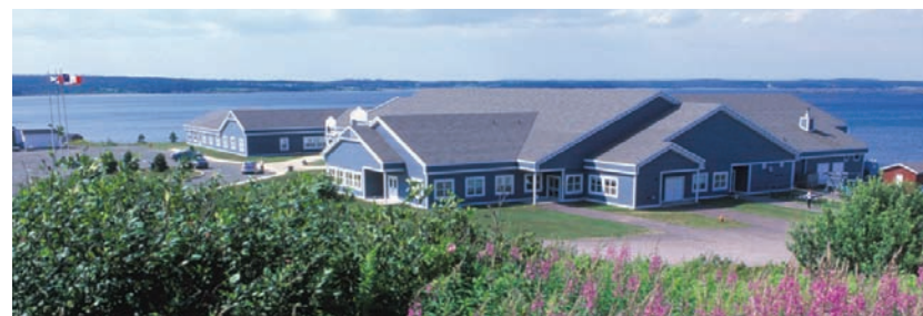
Le Centre communautaire culturel La Picasse.

Avec l'appui financier du ministère du Travail et de l'Éducation postsecondaire, le projet d'identification de produits touristiques acadiens et de développement de stratégies de commercialisation en est à sa deuxième phase. Le projet est parrainé par le Centre communautaire culturel La Picasse en partenariat avec l'Association touristique et commerciale de l'Isle-Madame.