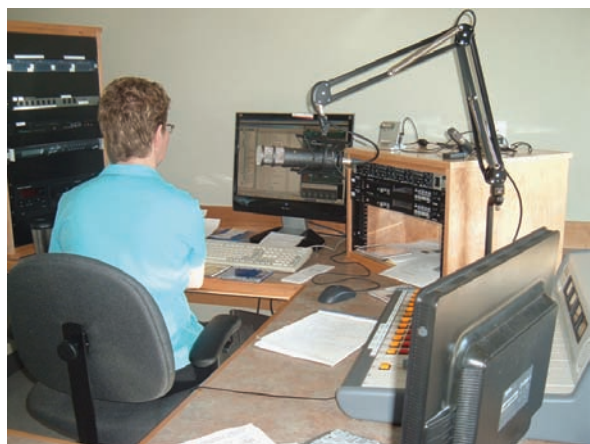
Une employée de La Picasse, travaille bénévolement dans la discothèque de Radio Richmond.

Cette nouvelle radio communautaire, est diffusée sur les ondes, depuis le 10 mars 2010 et a suscité beaucoup d'intérêt parmi les Acadiens et les Acadiennes de la région. Les émissions et les publicités quotidiennes sensibilisent les gens aux activités et aux produits de leur région en français. Ceci a pour effet à long terme de pérenniser le français dans la région ainsi que dans les villages environnants. En plus, la Coopérative Radio Richmond Ltée a créé deux postes permanents. Le RDÉE N.-É. a accompagné la radio dans l'élaboration de son projet de renforcement qui a été soumis et approuvé par le ministère du Patrimoine canadien. Ce projet de renforcement a permis à la radio de se doter de panneaux routiers publicitaires et de former les bénévoles. La Radio Richmond est diffusée au 104,1 FM dans le comté de Richmond ainsi qu'à Port Hawkesbury et dans d'autres régions avoisinantes.