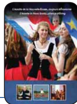
Le nouveau dépliant touristique pour les régions acadiennes en Nouvelle-Écosse a été conçu par le CDÉNÉ et réalisé grâce au financement du ministère du Tourisme, de la Culture et du Patrimoine. Si votre établissement aimerait se procurer une boîte afin d'afficher et distribuer le dépliant, veuillez contacter le CDÉNÉ.

Lors de la prochaine saison touristique, l'Acadie de la Nouvelle-Écosse invitera les visiteurs à vivre des expériences uniques et attrayantes, en découvrant sa culture à travers sa cuisine, ses traditions, sa musique, sa langue, son histoire et son environnement naturel ; une aventure haute en couleur et garante de la création de souvenirs inoubliables ! Un nouveau dépliant touristique a été créé par le CDÉNÉ pour présenter aux visiteurs un survol des régions acadiennes et les expériences qu'ils peuvent y vivre. Les dépliants ont été distribués dans les centres d'information aux visiteurs partout à travers la province et peuvent être téléchargés depuis le site Web du CDÉNÉ. Pour les gens qui sont prêts à passer à l'étape de l'aventure, les circuits touristiques au www.cdene.ns.ca/tourisme mettent en évidence les divers attraits de chaque région et offrent des suggestions d'activités, de logements et d'expériences à vivre – le tout sous forme d'itinéraires de voyage pour des séjours de durées variables qui amèneront les visiteurs à parcourir l'ensemble des régions acadiennes.