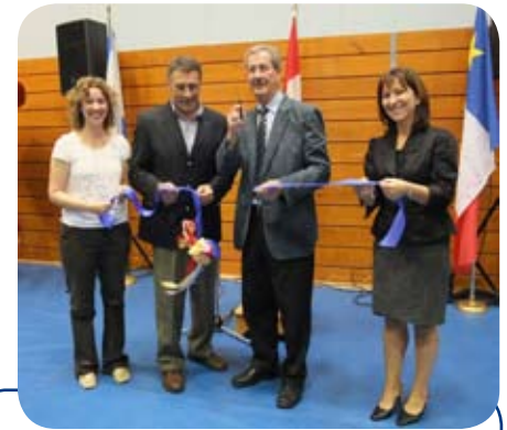
En haut : Les kiosques des entreprises au gymnase de l'Université Sainte-Anne. En bas : Coupure du ruban lors de l'ouverture officielle d'Expo-commerce 2009.