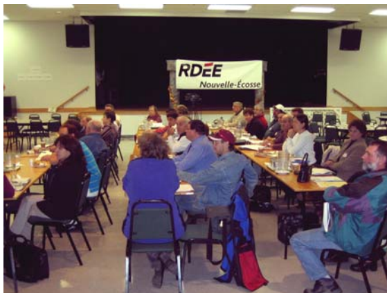
Forum à l'Isle Madame

Les personnes participantes ont également soulevé des pistes de solution et des opportunités de collaboration en plus d'apporter des priorités à celles-ci. Ces forums serviront de base à la création des plans communautaires.