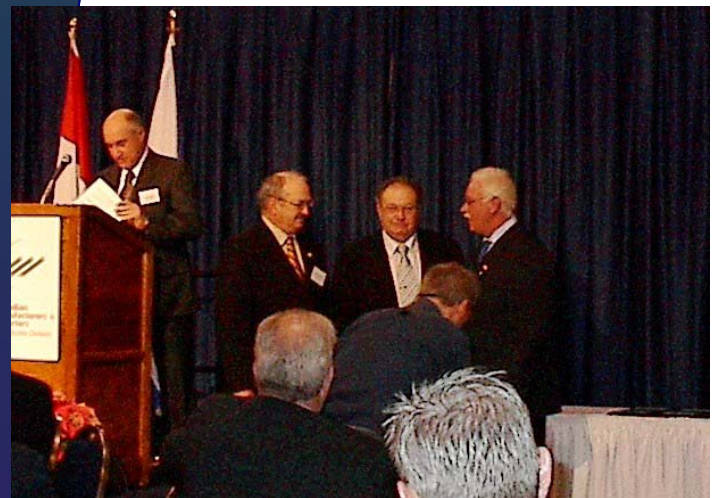
A.F. Thériault & fils Ltée. reçoit le Prix canadien d'innovation en nouvelle technologie 2005 pour la région de l'Atlantique / Nunavut au WTCC le 29 novembre 2005.