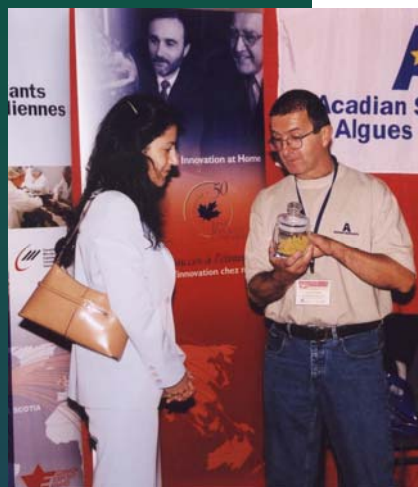
Expo Acadie 2004

Du grand succès de l'Expo Acadie 2004, évènement organisé par le CDÉNÉ en partenaire avec Landal Inc., est apparue la proposition d'une 2 e exposition par les divers intervenants dans ce projet valable.