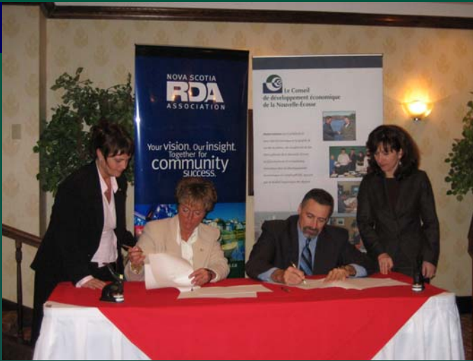
Le CDÉNÉ signe un protocole d'entente avec la NSARDA (Nova Scotia Association of Regional Development Authorities) le 1 er décembre 2005 à Halifax.