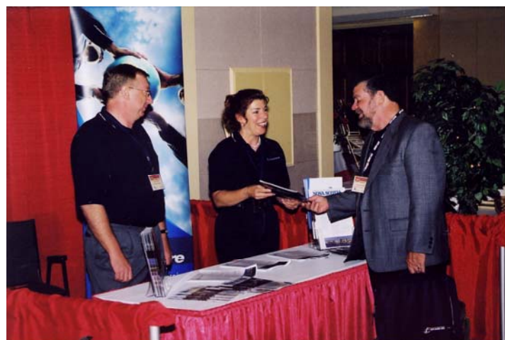
Expo Acadie 2004

Cet évènement d'envergure, ayant lieu dans le cadre du Festival International de la Louisiane, sera un temps merveilleux de mêler les affaires avec le plaisir. Voilà une expérience qui facilitera l'accroissement et la diversification de l'économie acadienne et francophone de la province!